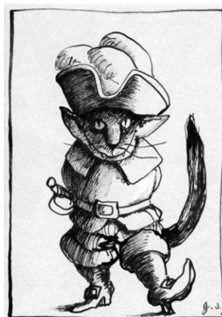
Le Chat Botté