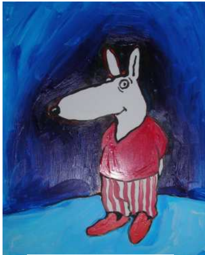
Gaëtan le lapin