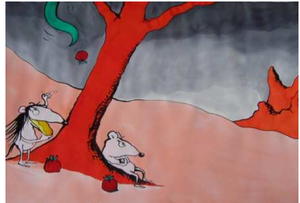
Adam et Eve